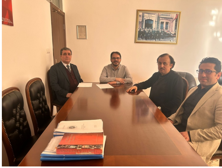
Yönetim Kurulu Toplantısı 31 Aralık 2024